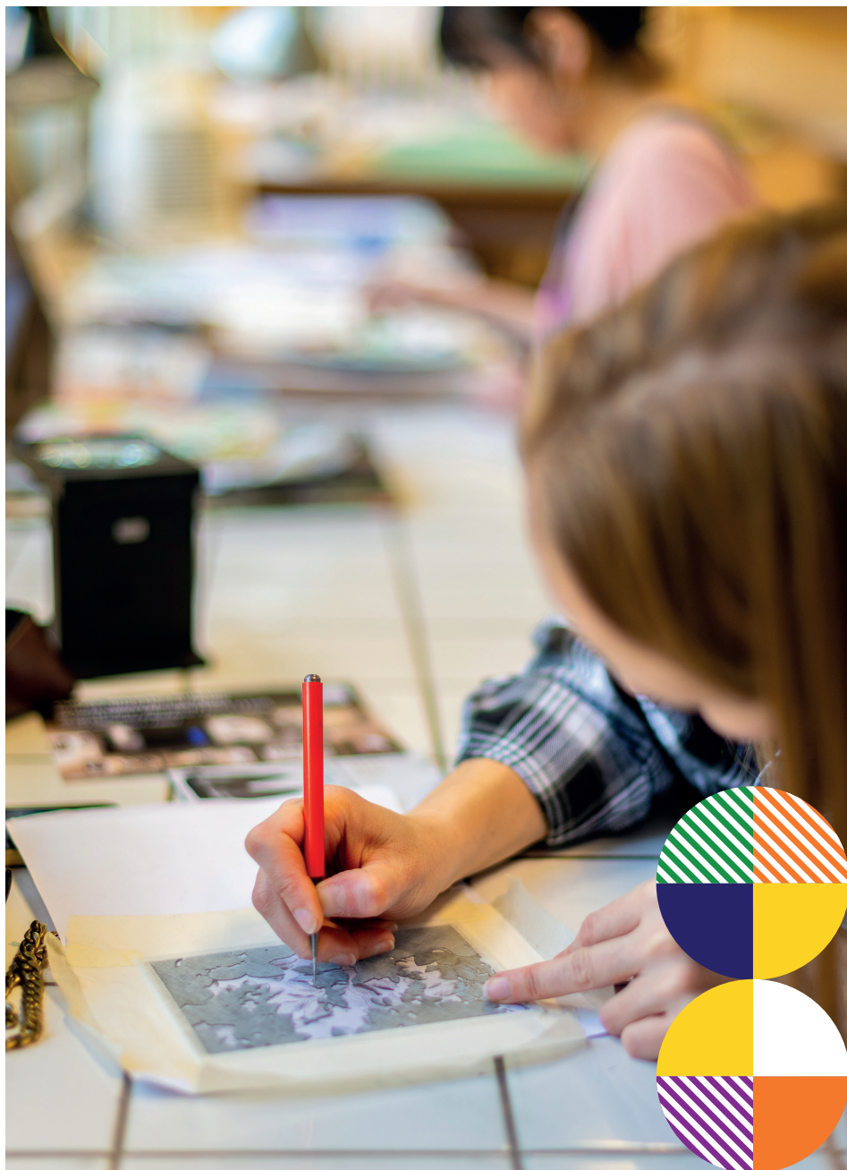
Photographie : Atelier gravure, édition Conception et réalisation : Service communication de Grand Poitiers - 2026